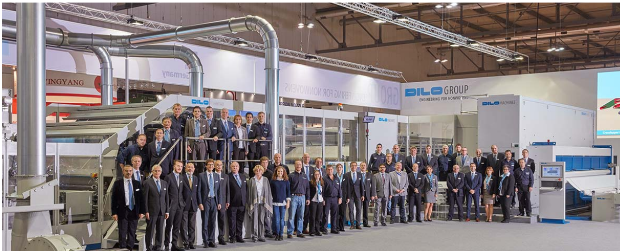
DILO – Messemannschaft

Techniker, Technologen und das gesamte Verkaufspersonal trugen gemeinsam dazu bei, dass allen Besuchern, Interessenten und Kunden die Vorteile und leistungsstarken Eigenschaften der DILO-Maschinenteknik verständlich wurden.