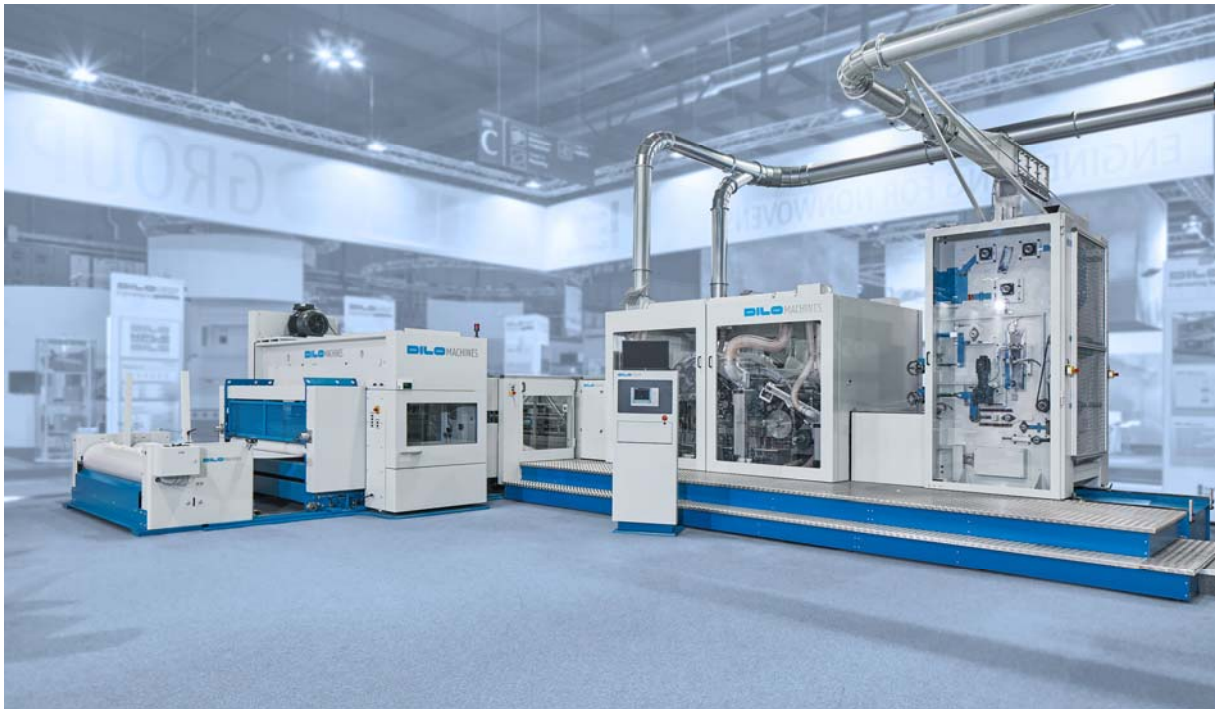
DILO-Kompaktanlage – ITMA 2015, Mailand

präsentierte DILO eine universelle Kompaktanlage, die künftig zur Verarbeitung von recycelten Carbonfasern eingesetzt wird.