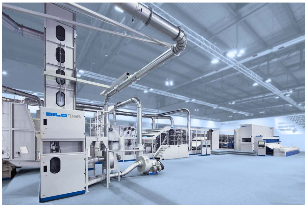
DILO-Hochleistungslinie auf der ITMA 2015 in Mailand

DILO zeigte auf dem über 1.200 qm großen Messestand als einziger Aussteller im Nonwovenssektor zwei komplette Anlagen, die außerdem mit Fasermaterial vorgeführt wurden.